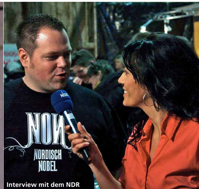
Interview mit dem NDR